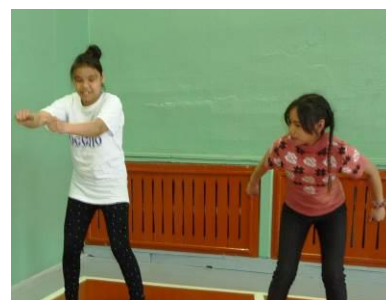
"Малые олимпийские игры"